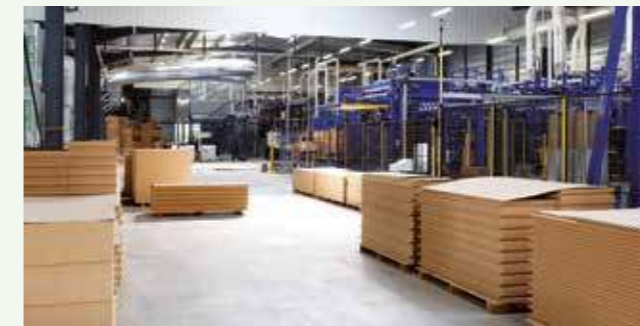
Mably (42) - Unité de fabrication d'isolants rigides Isonat

Les isolants Isonat sont conçus et fabriqués en France. Installée à Mably près de Roanne (42), l'usine de production Isonat intègre toutes les étapes de production : la matière première bois est issue de la filière locale, alimentée par les importants gisements forestiers présents en Rhône-Alpes.