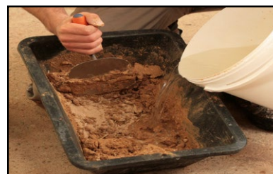
Étape 2 - préparation et humidification de l'enduit (spatule ou malaxeur)