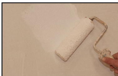
Étape 1 - application au rouleau de la sous-couche d'accroche Argilus.