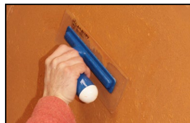
Étape 4 - à mi séchage, resserrer l'enduit à l'aide d'une spatule plastique souple.