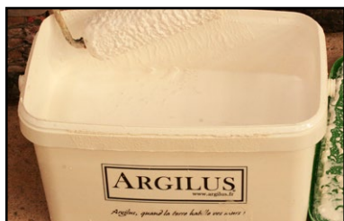
Bac sous-couche d'accroche Argilus