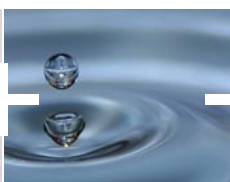
Protection contre l'humidité