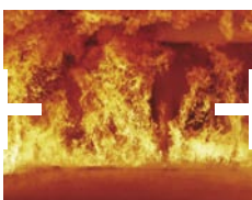
Protection contre le feu