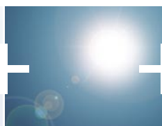
Protection contre la chaleur