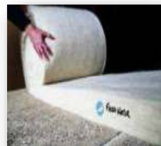
Stocker au sec

Ces informations sont données à titre indicatif, ces produits n'étant soumis à aucune norme actuellement.