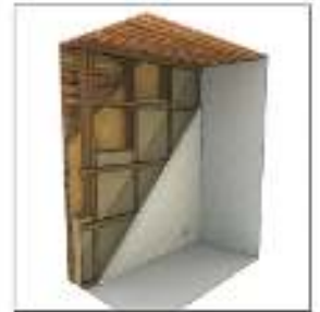
Isolation de murs ossature bois