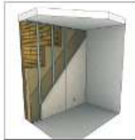
Isolation de murs maçonnés