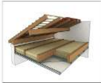
Isolation de combles non aménagés entre solives