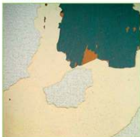
Support peinture arraché