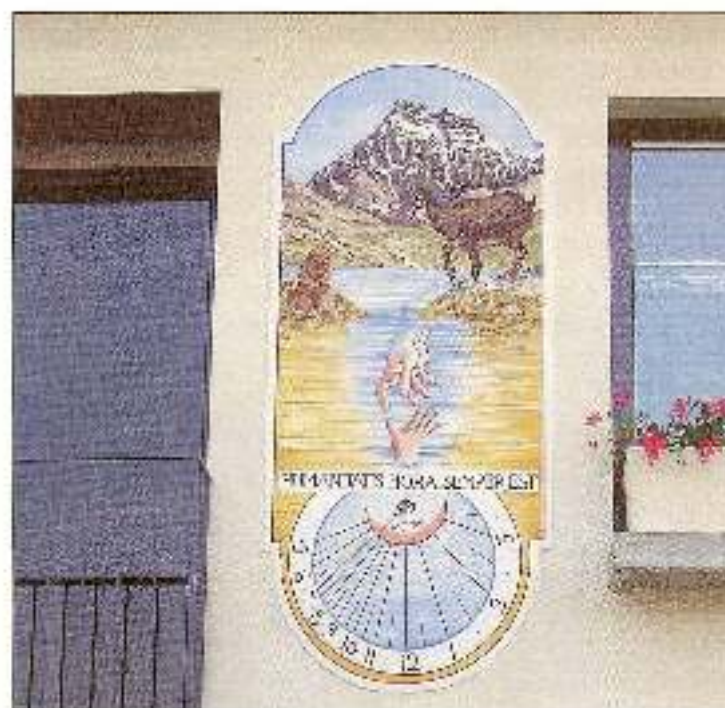
Capitole solaire (05)