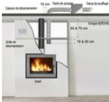
Schéma de montage n°1