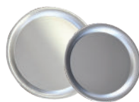
Plat alu 40 et 35 cm de diamètre