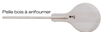
Pelle bois à enfourner