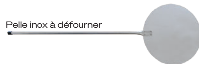
Pelle inox à défourner