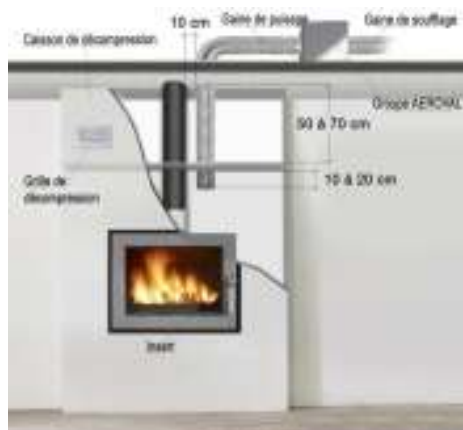
Schéma de montage n°1