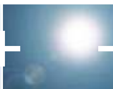
Protection contre la chaleur